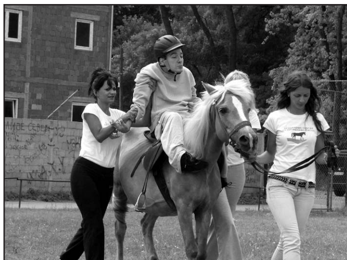
Неки од корисника нашег Дома пробали су јахање уз Београдски центар за хипорехабилитацију, а Влада је један од њих

Након додела признања, најуспешнијим такмичарима, као и подели захвалница свима који су помогли реализацију 12-их Олимпијских дана, уследио је свечани ручак (шведски сто), а након тога музика и дружење до касних вечерњих сати.