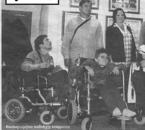
Инспирацијом побеђују хендикеп

Представљени радови станара Дома за одрасла инвалидна лица у Земуну