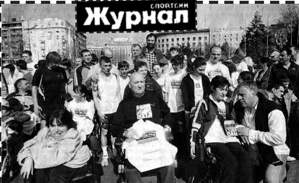
И ОНИ СУ СЕ РАВНОПРАВНО БАВИЛИ СПОРТОМ: Паралегичари са Вороњиним, Дивцем и Крецловићем