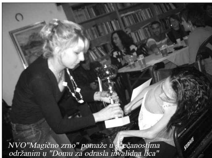
NVO "Magično zrno" pomaže u svečanostima održanim u "Domu za odrasla invalidna lica"

Iako godinama boravim u ovoj Ustanovi, osim odlazaka kući, nisam baš bila raspoložena da izlazim sa mojim drugarima iz Doma na koncerte, izlete... nekako sam se povlačila u sebe i sigurnost svoje sobe, odnosno ponekog vikenda kod svoje porodice.