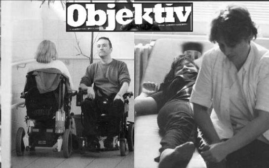
За разлику од стационара унутрашњости, Дом за invalidna lica на Бежанјаској коси има rampe које омогућавају станарима да слигну до соба на spratu, у случају да се поквари lift.