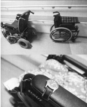
Дом је основан пре 11 година, а већина станара је ту од самог почетка. Иако имају организоване радне терапије, немају своја примања, а живе од породичних пензија и прати на туђу негу и помоћ.