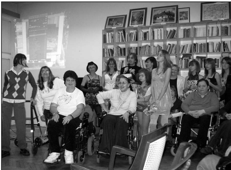
Радионичари креативне радионице „Вредне руке” и манекени