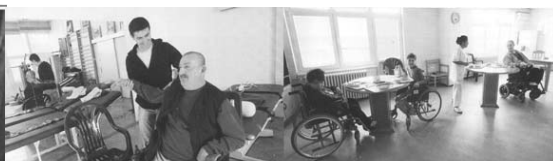
Неке активности у дому, као физиотерапија, су обавезне јер од њих зависи моторне функције. Када заврше вежбе станари могу да се опусте, разговарају и друже. Од скоро имају и брзи интернет, па су многи отворили профил на Facebook-у.